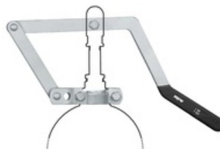
RIV 151 Leva di manovra con fermo in apertura serie Perla / Diamante / Centurion / Vulcano