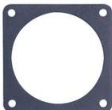
RIV 150 Controflangia in acciaio