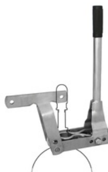
RIV 153 Leva di manovra con fermo in apertura serie Perla