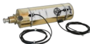
RIV 161 Cilindro doppio effetto pneumatico in ottone con sistema PPS e sensori di posizione serie Perla / Diamante / Centurion / Vulcano